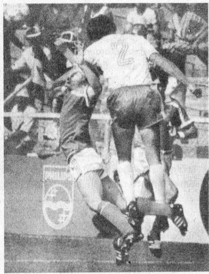
Frankreichs Abwehrspieler Amoros - hier im erfolgreichen Duell mit dem Kanadier Norman (links) - beeindruckte bei der WM-Endrunde in Mexiko mit seiner kraftvollen, offensivfreudigen Spielweise. Am 19. November stellt er sich mit dem Titelverteidiger und WM-Dritten im Leipziger Zentralstadion vor.

Noch sind alle Preisgruppen vorhanden (10,10, 8,10 und 5,10 M). Bestellungen können an den BFA Fußball, Sportforum, Leipzig, 7010, gerichtet werden. Für jedes Spiel ist eine gesonderte Bestellung aufzugeben. Bitte nur Postkarten verwenden und den Absender deutlich angeben. Jede Bestellung wird beantwortet, es erfolgt keine schriftliche Bestätigung.