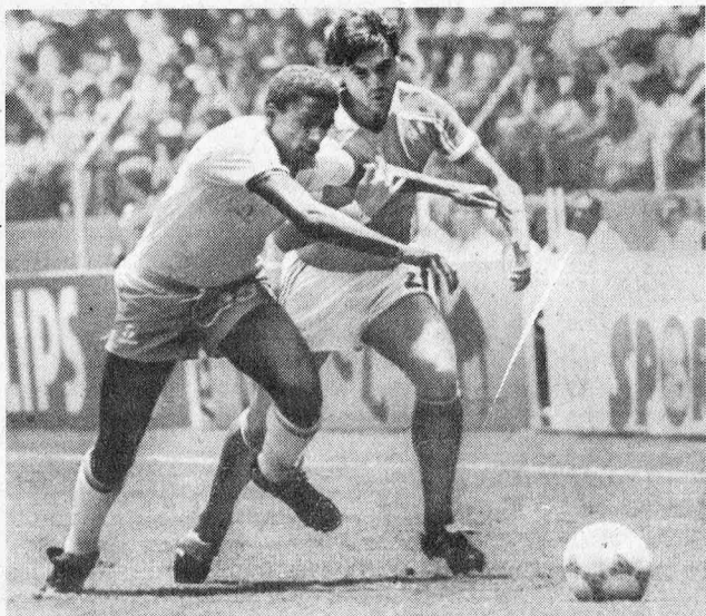
Im Spiel zwischen Brasilien und Frankreich trafen nicht nur zwei hervorragende Mannschaften aufeinander, standen sich vielmehr auch ausgezeichnete Einzelkötter gegenüber. Zwei von ihnen waren Josimar (links) und Battiston, die am Ende auch zum Kreis der „Welt-Elf“ gehörten.

Nach Felix Magath, Ditmar Jakobs, Norbert Eder und Hans-Peter Briegel hat in der vergangenen Woche mit Karl-Heinz Rummenigge der fünfte aus dem WM-Team der BRD seinen Verzicht auf weitere Auswahlberufungen mitgeteilt. Der 30-jährige Mannschaftskapitän bestritt 95 Länderspiele, stand zweimal im WM-Finale (1982, 86), gehörte der Europameistermannschaft von 1980 an, wurde mit Bayern München 1975 und 1976 Europapokalsieger der Landesmeister. Nach langwieriger Verletzung hatte er zuletzt seine Bestform nicht wieder erreicht und war in Mexiko im Kreis der Mannschaft stark umstritten. Jetzt will er nur noch für Inter Mailand spielen, wo er seit 1984 unter Vertrag steht.