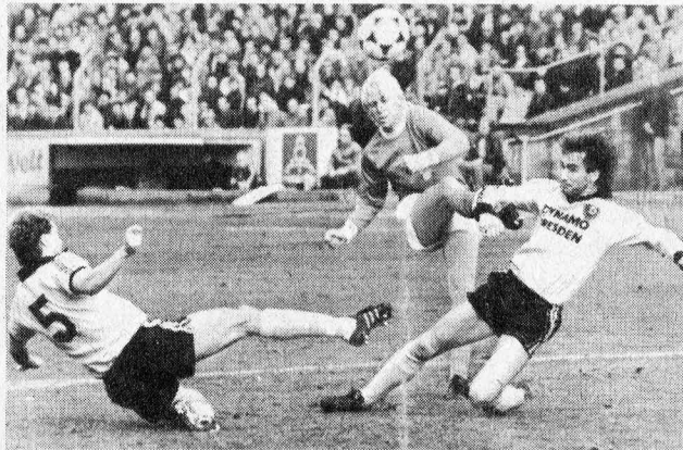
Gutklassige, abwechslungsreiche Spiele und volle Zuschauerstände wünschen wir uns künftig in unseren Stadien. Eine gesunde Wechselwirkung zwischen Aktiven und Anhängern spornt an und wirkt ebenfalls leistungsfördernd.

Es geht für unsere Nationalmannschaft und Olympiiauswahl darum, die Stammbildungen weiter zu festigen, die Aktiven in gute psychische und physische Verfassung für die kommenden Aufgaben in der Europameisterschaft und der Olympia-Qualifikation zu bringen. Das heißt, noch mehr Leistungsträger wie René Müller, Andreas Thom, Frank Rohde und Matthias Liebers zu entwickeln und zugleich das Angebot für unsere Auswahlvertretungen zu erhöhen. Die Verbesserung der individuellen Leistungen schafft die Voraussetzungen für ein weiteres Voranschreiten in der Durchsetzung der modernen taktischen Anforderungen des Abwehr- und Angriffsspiels, insbesondere der kombinierten Mann-Raum-Deckung, der variablen Angriffsgestaltung durch ein schnelles Umkehrspiel, dem wechselseitigen Vorstoßen der Abwehr- und